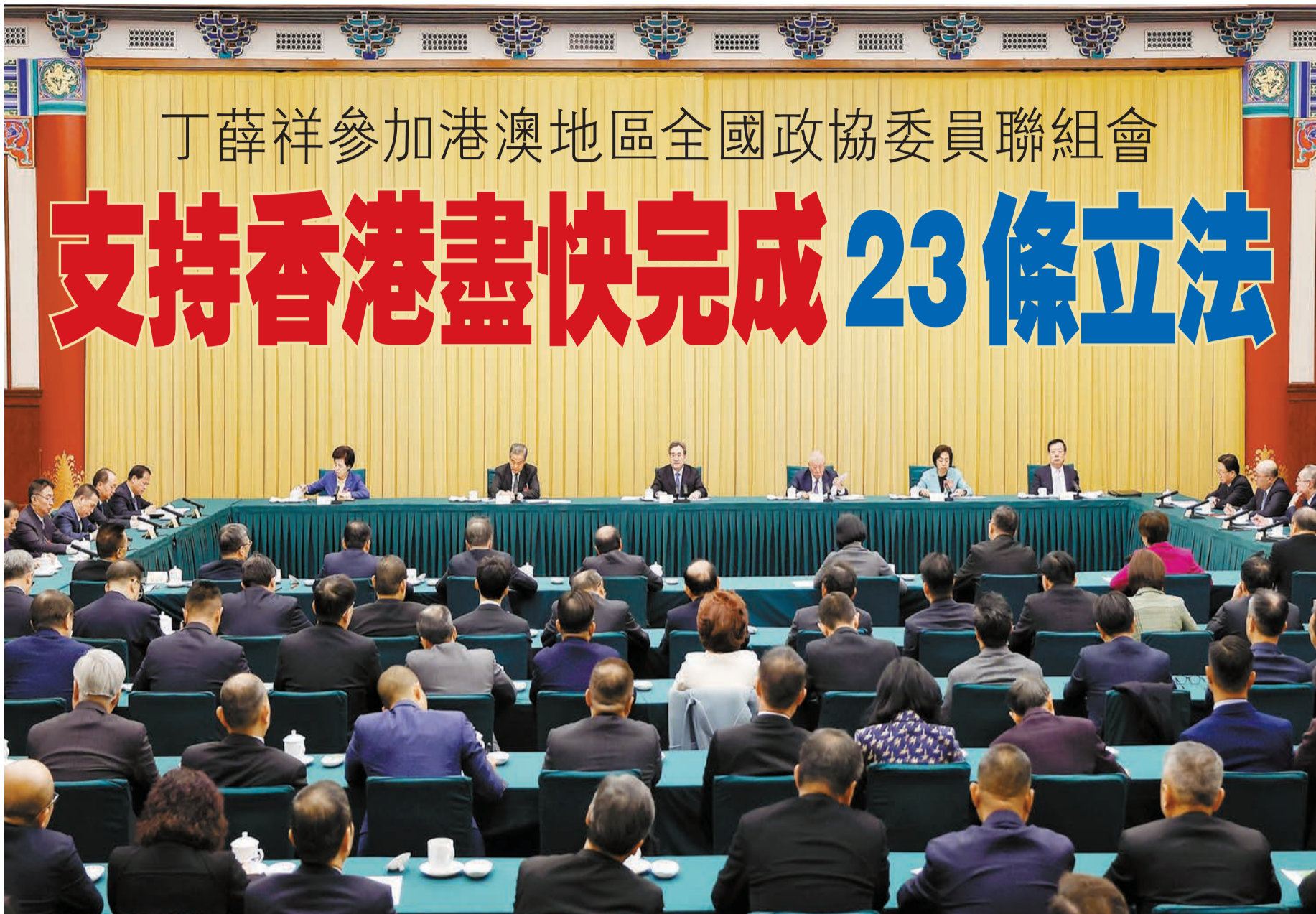
3月6日，中共中央政治局常委、國務院副總理丁薛祥在北京參加港澳地區全國政協委員聯組會。