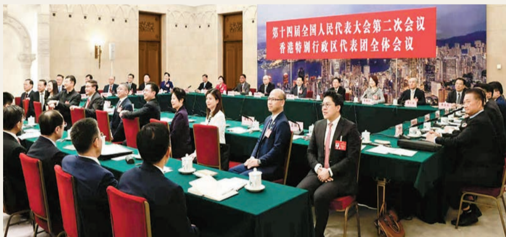
昨日下午，十四屆全國人大二次會議香港代表團在人民大會堂香港廳舉行全體會議，審議政府工作報告。港區全國人大代表踴躍發言，高度評價政府工作報告，並結合香港實際提出建議。國務院港澳辦常務副主任周霽，國務院港澳辦副主任、中聯辦主任鄭雁雄參加會議。

【香港商報訊】記者楊琪、黃裕勇報導：昨日下午，十四屆全國人大二次會議香港代表團在人民大會堂香港廳舉行全體會議，審議政府工作報告。港區全國人大代表踴躍發言，高度評價政府工作報告，並結合香港實際提出建議。國務院港澳辦常務副主任周霽，國務院港澳辦副主任、中聯辦主任鄭雁雄參加會議。