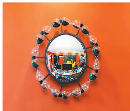
▲ 阿诺菲尼 (装置) 列思 (法)

艺术因交流而更加精彩。艺术家需要在广泛的交流中了解世界，吸收新的信息，收获新的感触，推动艺术创作向前走。这些交流活动开阔了我的视野，让我可以从更多角度去思考，去创作，我也更加自信了。期待未来有机会参加更多中外文化艺术交流活动。