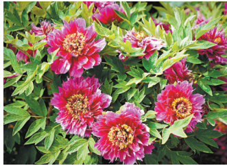
◆洛陽牡丹在田野間盛放。

牡丹成為「花中之王」，源於時代的機緣。最初野生牡丹品種還是相對單調，二十世紀上半葉，內憂外患，牡丹資源瀕臨絕境；新中國初期，為牡丹登記的品種只有600多個，為了搶救古老品種，至今培植的品種，就有1,394個；二十世紀八十年代，是牡丹的高光時刻，1982年確立為洛陽市花，翌年舉辦首屆牡丹花會，經歷了40年發展，牡丹會跳出了賞花經濟，創出了新文旅，國花牡丹，帶來了唐宮樂宴，放燈遊園，牡丹入饌、鮮花餅食、牡丹籽油、牡丹酒、牡丹花茶……走向千家萬戶，邁向國際。