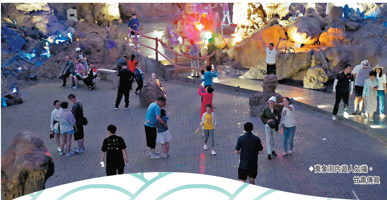
◆萬象洞內遊人如織。