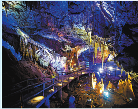
▼新洞內景觀保存相當完整。