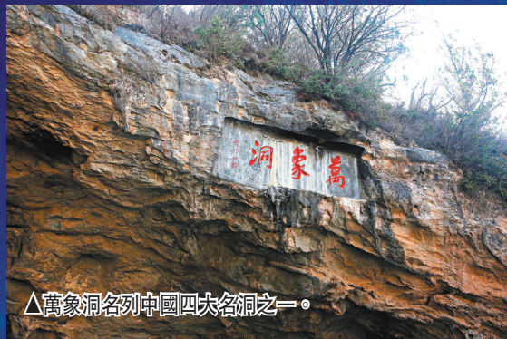
△萬象洞名列中國四大名洞之一。