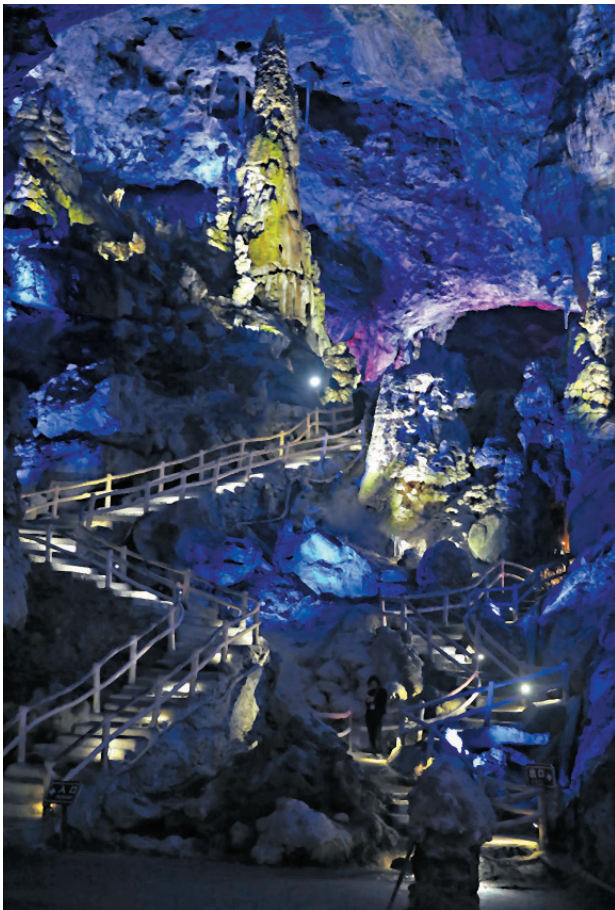
▲萬象洞享有「華夏第一洞」的盛譽。