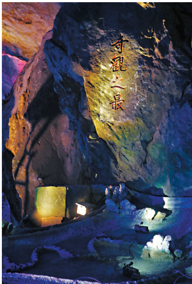
▲萬象洞留有眾多不同朝代的碑刻。