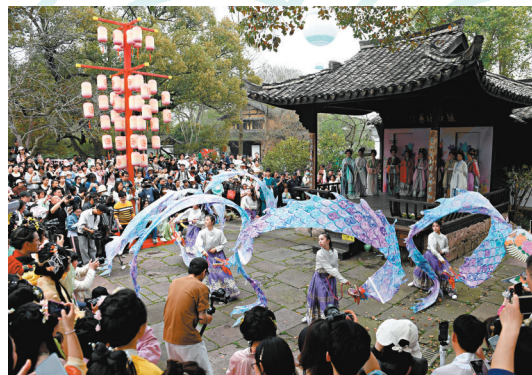
▲遊客在西溪濕地深潭口古戲台觀看花朝節表演。