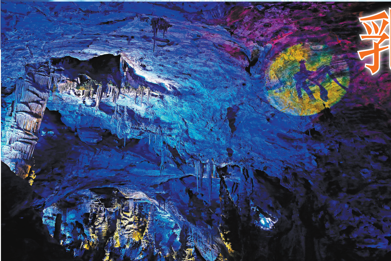
▲洞內運用聲光電講述美麗傳說。