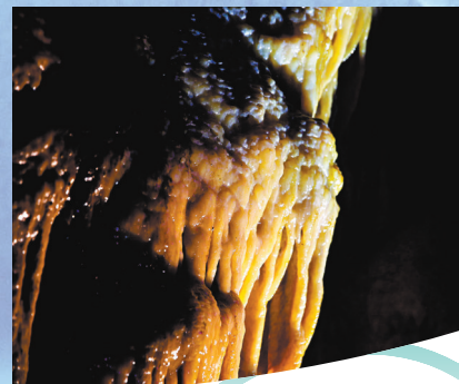
◀發育初期的溶洞景觀。