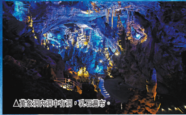
△萬象洞內洞中有洞，乳石遍佈。