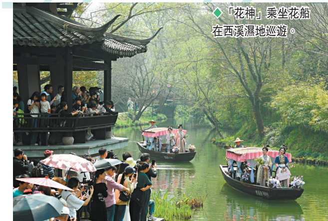
◆「花神」乘坐花船在西溪濕地巡遊。