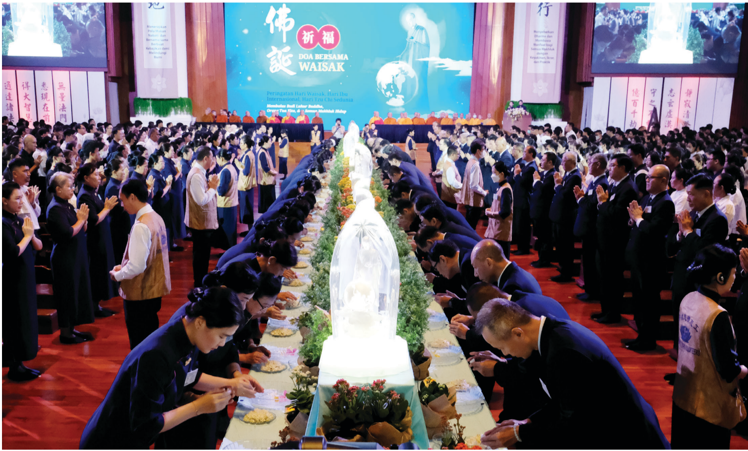
2024年5月12日，慈濟印尼分會于靜思堂举办浴佛典禮，共有两千八百八十六人共同参与。