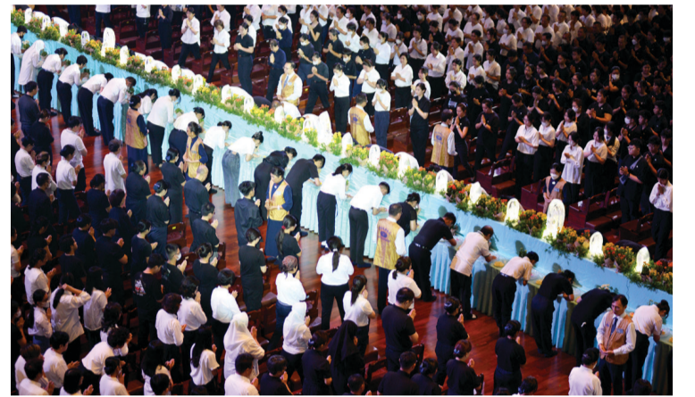
四十七位佛教諸山長老與法師帶領大眾浴佛。

2024年5月12日，慈濟印尼分會于靜思堂举办浴佛典禮，共有两千八百八十六人共同参与，人人虔诚一念心共沐佛恩、同沾法喜。