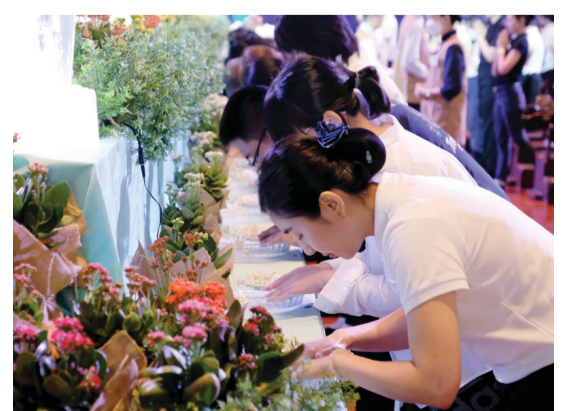
「禮佛足、接花香、祝福吉祥」隨著司儀的口號，人人緩緩走向浴佛台，彎下腰虔誠浴佛。