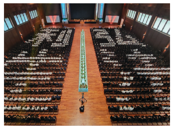
今年的浴佛典禮，共有一千三百九十二人組成「弘法利生」圖騰。