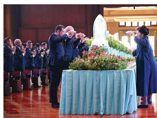
慈濟委員上前供燈燭、香湯、花香。