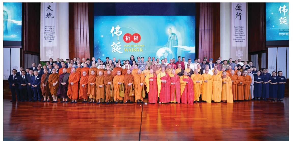
浴佛典禮結束之後，佛教諸山長老與法師、宗教人士、受邀嘉賓、慈濟志工一起合照。