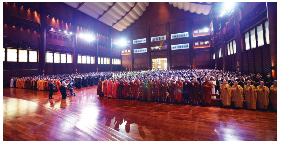
共有四十七位佛教諸山長老與法師、四十九位宗教人士與受邀嘉賓，以及两千八百八十六位民眾一起虔誠浴佛。