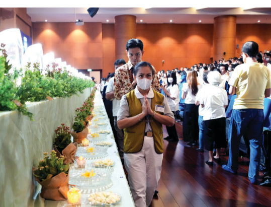
除了在靜思堂的講經堂，印尼慈濟也在國際會議廳、福慧廳、喜舍廳，準備浴佛台提供大眾浴佛。