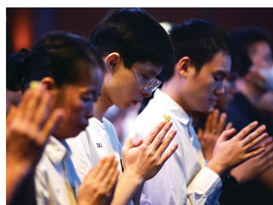
浴佛典禮尾聲，人人虔誠祈禱。