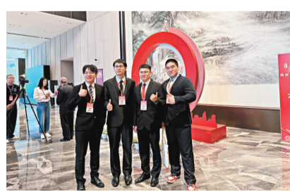
台灣青年在開幕式現場打卡。

對「台獨」分裂和外部干涉，推動兩岸關係和平發展、融合發展，推進祖國統一進程。 洪秀柱：要懷抱「兩岸一家」親情 中國國民黨前主席、中華青雁和平教育基金會董事長洪秀柱在開幕式上發言時呼籲，無論風浪多麼險惡，面臨的挑戰多麼艱巨，兩岸同胞都要懷抱著「兩岸一家」的親情，守護共同的家園，共創民族的未來。