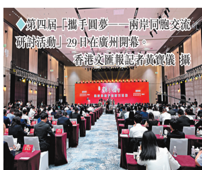
第四屆「攜手圓夢——兩岸同胞交流研討活動」29日在廣州開幕。

中共中央台辦、國務院台辦主任宋濤在致辭中表示，廣大台灣同胞具有光榮的愛國主義傳統，要牢固堅持一個中國原則，堅決反