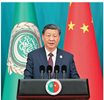
習近平主席發表主旨講話。