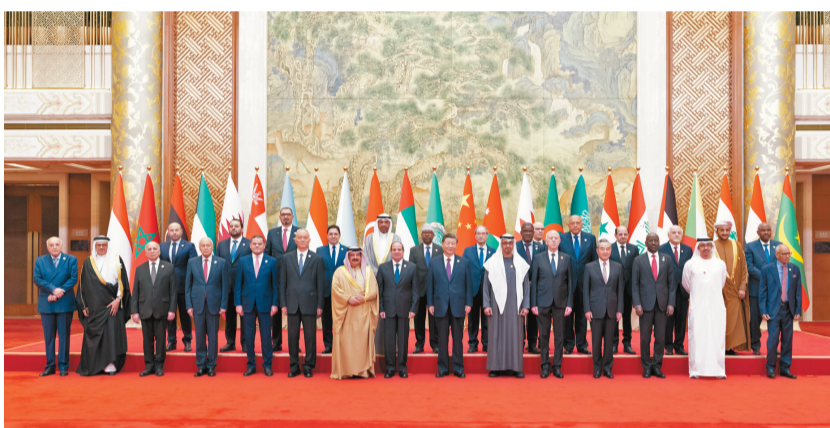
中國國家主席習近平同巴林國王哈馬德、埃及總統塞西、突尼斯總統賽義德、阿聯酋總統穆罕默德、阿盟秘書長蓋特以及22位阿拉伯國家代表團團長集體合影。