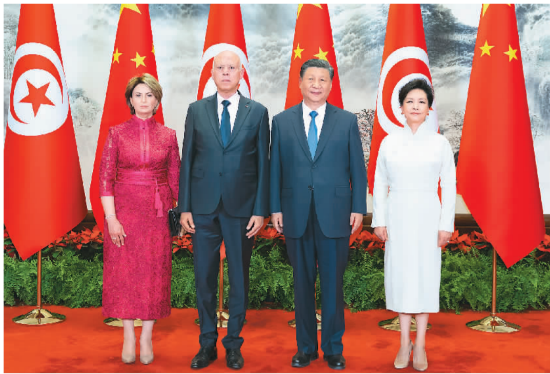
五月三十一日上午,国家主席习近平在北京人民大会堂同来华国事访问并出席中国—阿拉伯国家合作论坛第十届部长级会议开幕式的突尼斯总统赛义德举行会谈。这是会谈前,习近平和夫人彭丽媛同赛义德和夫人伊什拉芙合影。