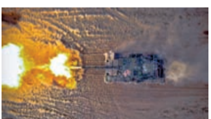
近日，第72集團軍某旅開展裝甲實彈射擊訓練。

香港文匯報訊（記者 王珏）央視國防軍事頻道官方微博「央視軍事」披露，近日解放軍陸軍第72集團軍某合成旅組織裝甲分隊跨晝夜戰鬥射擊考核。突擊車組進行間對