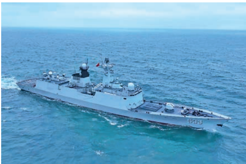
董軍表示，將以及時堅決有力的作為，遏止「台獨」。圖為解放軍054A護衛艦「南通艦」參與「聯合劍刺-2024A」演習。

董軍表示，中方堅持通過對話協商解決分歧，鄙視「叢林法則」，在處理邊界和海上分歧中，從不主動挑起事端，從不輕易訴諸武力，始終與各國共同努力，推動落實《南海各方行為宣言》，加緊《南海行為準則》磋商，有效維護了地區和平安寧。