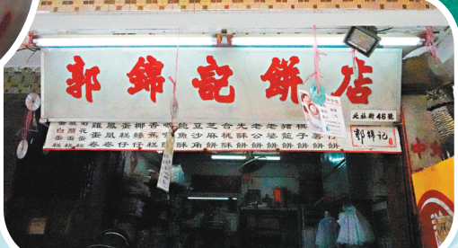
◆郭錦記餅店是長洲的老字號餅店。