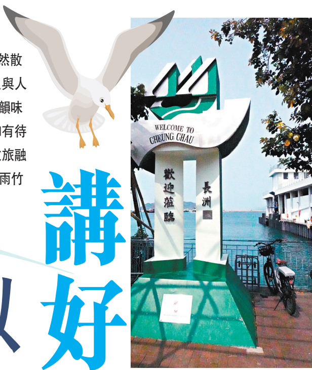
◆長洲碼頭的歡迎牌。