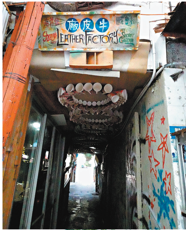
◆坪洲牛皮廠正門隱蔽地藏在道路一側。