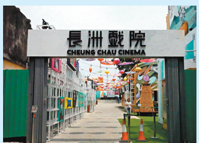
◆長洲戲院多元文化園區是長洲戲院及周邊區域活化後的產物。

香港立法會旅遊界議員姚柏良於日前接受香港文匯報記者訪問，針對離島旅遊資源的開發與現狀，以及完善各種設施的問題分享了他的構思與建議。他指出，除太平山、迪士尼樂園、海洋公園等眾多旅客「必去」的景點外，香港也需要開拓不同類型的、具有文化特色的景點。