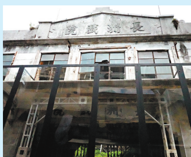
◆現被圍起的長洲戲院遺蹟。