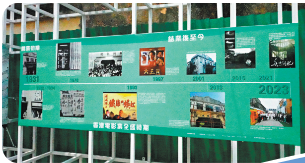
◆長洲戲院曾服務長洲居民逾60年。