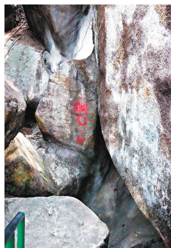
◆長洲位置隱秘的張保仔洞。