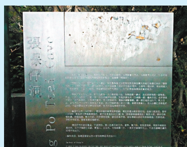
◆張保仔洞模糊不清的信息牌。