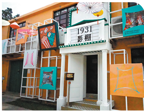
◆長洲戲院多元文化園區的1931影棚。