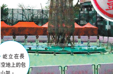
◆屹立在長洲空地上的包山架。