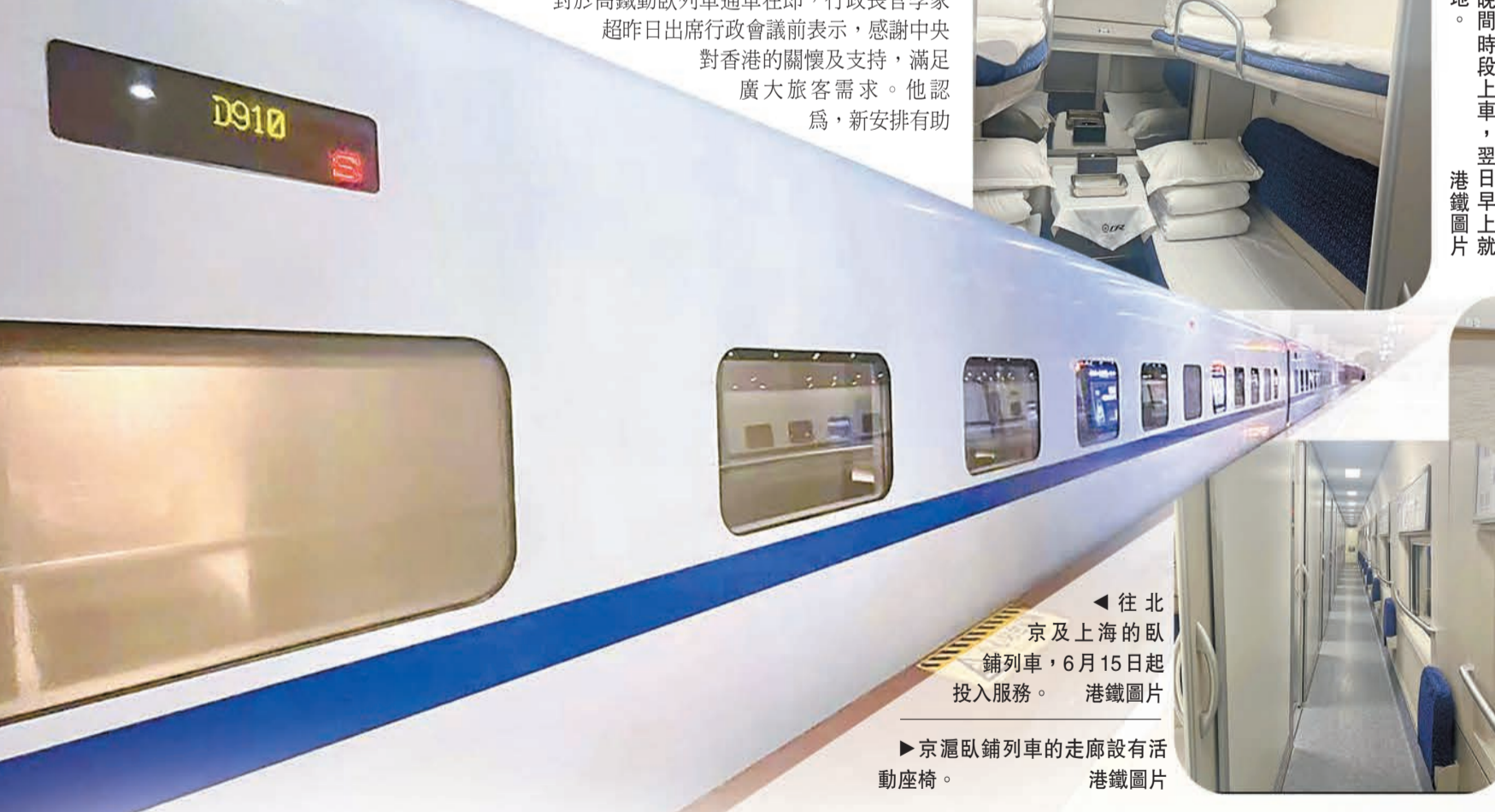
▲往北京及上海的動臥鋪列車，6月15日起投入服務。