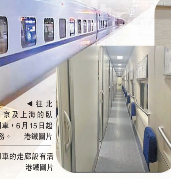
▲臥鋪列車由2個二等座車廂、13個動臥車廂和1個餐車組成。