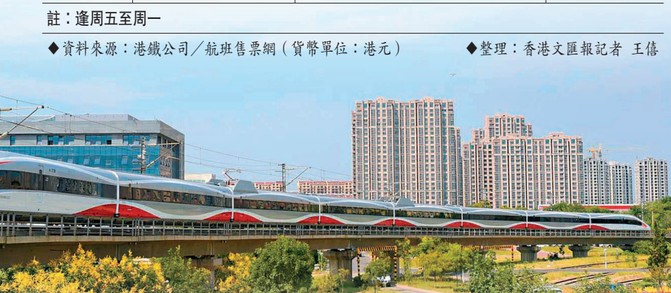
京港、滬港直通車將提質升級為高鐵動臥列車，6月15日開通。