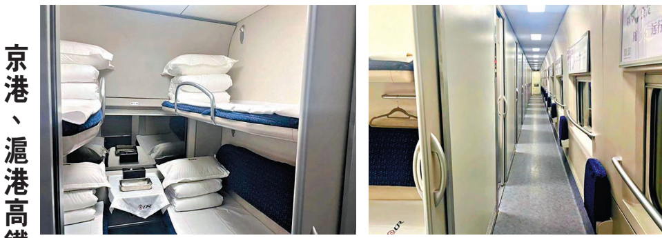
動臥列車內的臥鋪。