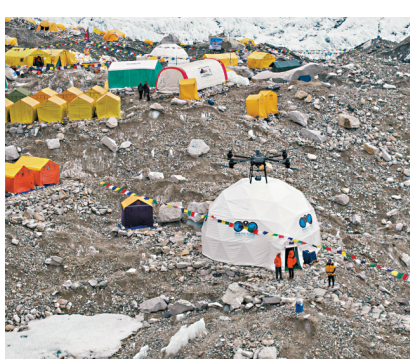
4月30日，大疆運載無人機在珠穆朗瑪峰南坡大本營進行物資運輸測試。新華社

香港文匯報訊 據新華社報道，知名無人機企業深圳市大疆創新科技有限公司5日宣布，在珠穆朗瑪峰南坡一側完成了首次民用無人機高海拔運輸測試。這也是全球首次民用運載無人機在海拔5,300米至6,000米航線上的往返運輸測試，創造了民用無人機最高海拔運輸紀錄。