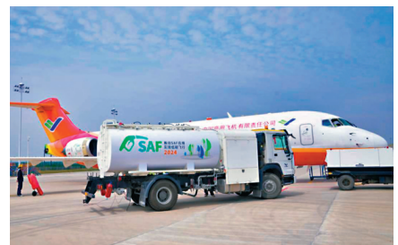
ARJ21支線客機加注可持續航空燃料準備演示飛行。

中國商飛表示，將積極融入全球航空業綠色發展進程，堅持在商用飛機研製全過程踐行綠色發展理念，努力研製「綠色飛機」，建設「綠色家園」，構建「綠色供應鏈」，打造三位一體的「綠色商飛」。