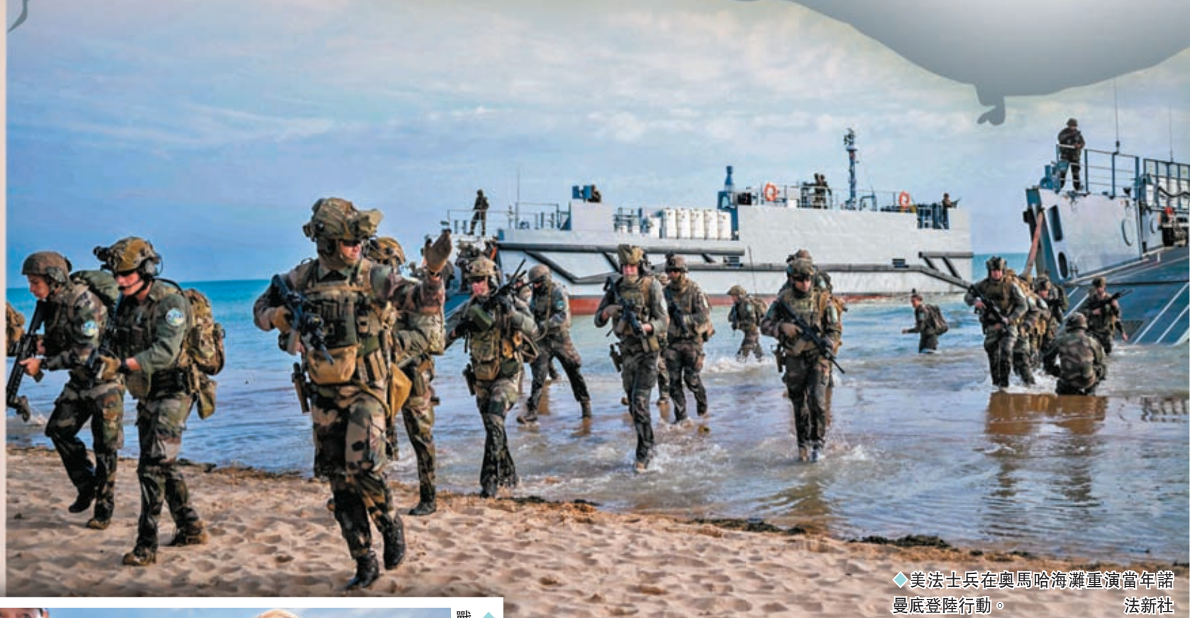
◆美法士兵在奧馬哈海灘重演當年諾曼底登陸行動。

當西方領導人向二戰老兵致敬時,他們卻心繫已持續兩年多的俄烏衝突。法國已邀請烏克蘭總統澤連斯基出席紀念活動,反而以俄羅斯對烏發動軍事行動為由,未有邀請俄總統普京或其他官員出席,試圖顯示西方與烏克蘭團結一致。然而諾曼底登陸紀念活動的主辦單位4月卻宣布,雖