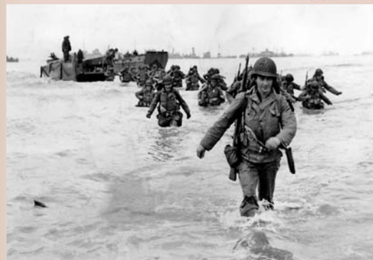
◆英美等國家組成的二戰盟軍,逾15萬軍人80年前橫渡英法海峽。

香港文匯報訊 今天(6月6日)是二戰盟軍諾曼底登陸(D-Day) 80周年,西方多國領導人將在法國北部諾曼底海岸的海灘上舉行紀念活動。在俄烏衝突持續逾兩年仍未平息下,歐洲正被戰火陰霾籠罩,西方國家的團結備受考驗。