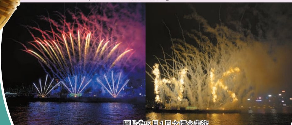
圖片為5月11日之煙火表演

開放日期及時間：6月15日時間晚上8時至8時10分 地點：灣仔海濱場地對出海面 如何前往：港鐵會展站A3出口經行人天橋步行約5分鐘、從尖沙咀碼頭乘搭天星小輪 建議觀賞位置：灣仔「HarbourChill海濱休閒站」 「水上運動及康樂主題區」