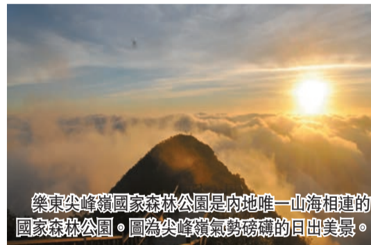
樂東尖峰嶺國家森林公園是內地唯一山海相連的國家森林公園。圖為尖峰嶺氣勢磅礴的日出美景。

開發建設，完善尖峰嶺、毛公山景區、四月天公園配套設施，發展多種業態，與三亞、保亭、陵水共同開發一批跨市縣旅遊線路。優化樂東港、嶺頭港、鶯歌海港等港口布局，建成龍樓灣休閒漁業接駁點，謀劃啟動遊客接待中心項目。推動龍樓灣康養產業等項目落地。舉辦系列文旅活動，培育一批有影響力的文旅演藝精品項目，力爭全年接待遊客350萬人次以上。近日，海南樂東龍樓灣國家級智慧海洋牧場第三座深遠海智能養殖旅遊平台「普盛海洋牧場6號」在廣州南沙命名交付，與此前成功投放的兩個平台一同深化「海洋牧場+深遠海養殖+休閒漁業」的融合發展模式，構建具有樂東特色的多元化農文融合產品體系。