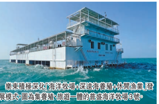
樂東積極深化「海洋牧場+深遠海養殖+休閒漁業」發展模式。圖為集養殖、旅遊一體的普盛海洋牧場3號。