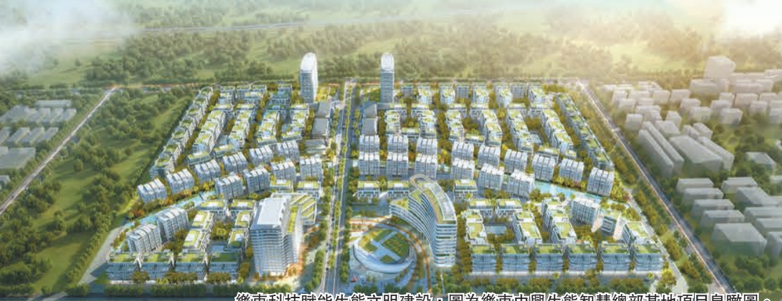
樂東科技賦能生態文明建設，圖為樂東中興生態智慧總部基地項目鳥瞰圖。

雄關漫道真如鐵，而今邁步從頭越。在海南自貿港封關運作的關鍵之年，樂東依託政策創新，科技賦能，全力鑄定「三區」發展定位不斷前進。2023年新增市場主體15212家，同比增長183.75%。2021年至今樂東縣新增存續市場主體約24846家，增長率達33%。樂東高質量發展的畫卷正徐徐展開，越來越受到國內外投資者的關注。