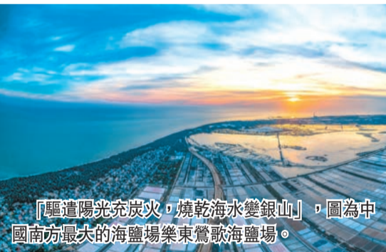
「驅遣陽光充炭火，燒乾海水變銀山」，圖為中國南方最大的海鹽場樂東鶯歌海鹽場。