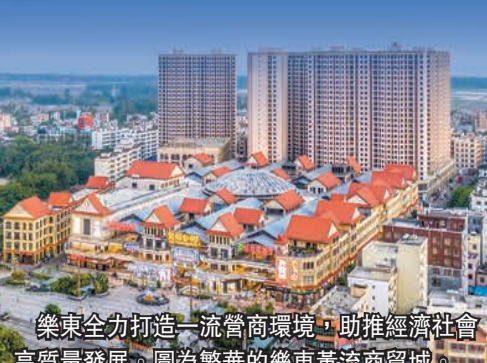
樂東全力打造一流營商環境，助推經濟社會高質量發展。圖為繁華的樂東黃流商貿城。

粵港澳大灣區是中國開放程度最高、經濟活力最強的區域之一，區域內生發展動力強勁、發展活力充沛、創新能力突出、產業結構優化、要素流動順暢，是樂東向種圖強、向海圖強、向綠圖強的有力合作夥伴，在科技賦能南繁育種、農業漁業創新、先進製造業以及科研企業落地方面有無限廣闊的前景。