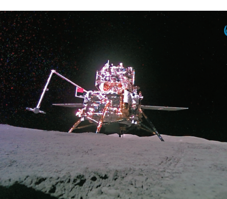
◆6月3日，嫦娥六號攜帶的「移動相機」自主移動並成功拍攝、回傳著陸器和上升器合影。

香港文匯報訊 據中新社報道，中國國家航天局4日發布了嫦娥六號著陸器和上升器的合影。月球上這張合影在網絡上刷屏，不少網友好奇這是如何拍攝的？「攝影師」又是誰？其實這張合影由嫦娥六號攜帶的「移動相機」自主移動並拍攝、回傳。記者6日從中國航天科技集團五院獲悉，這台「移動相機」是該院研製的月面自主智能