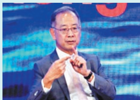
◆余偉文表示，過去幾年香港已證明了作為國際金融中心應有的韌性和靈活性。

充分發揮融通中外資本能力 余偉文表示，作為國際金融中心，香港必須不斷創造新的機會，讓金融機構、人才都願意到港安居樂業，香港其中一個明顯的機遇則來自內地。截至今年4月底，各項人才入境計劃收到約29萬宗申請，批出約18萬宗，當中逾12萬名人才已到港，他們對香港的勞動力和經濟發展都帶來正面支持。香港正在深化及擴大互聯互通，目前北向通發展成熟，約70%境外投資者透過滬深港