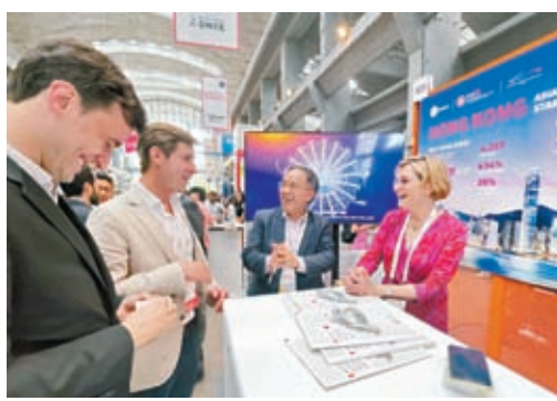
◆許正宇(右二)在西班牙馬德里參觀南方峰會的展覽攤位。

香港文匯報訊(記者周紹基)香港特區政府5日晚發聲明，羅列相關數據及事實，闡明香港亮麗前景，不點名反駁羅奇唱淡香港的言論。正在訪歐行程的香港財庫局局長許正宇6日在局方的Fb上表示，他在西班牙馬德里參與科技和初創企業盛事南方峰會(South Summit)，並與西班牙證券交易所的高層管理人員會面，推介香港的獨特優勢。另在6日商會的訪問中，許正宇強調，香港享有「一國兩制」的優勢，加上國家的大力支持，香港國際金融中心具有戰略定位，穩定環境如定海神針。