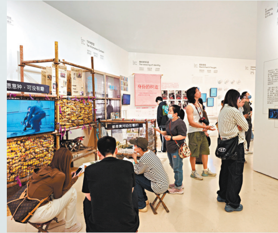
▲觀眾在中央美術學院美術館參觀央美設計學院研究生畢業作品。

今天很多青年策展人沒有將策展視為可以謀生的職業，而是更多視策展為副業，大多都是有着多重身份的年輕學者。在成為合格、優秀的策展人的路途中，既需要個人自覺性的探索和長期堅守，也需要外部建立長期有效的激勵機制。為此，他提出，相關部門要構建身份認同，為策展人與藝術機構之間搭建溝通平台，並注重項目運作和資金籌措能力的培養。