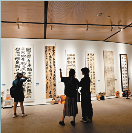
▲觀眾在中央美術學院美術館參觀央美書法學院研究生畢業作品。