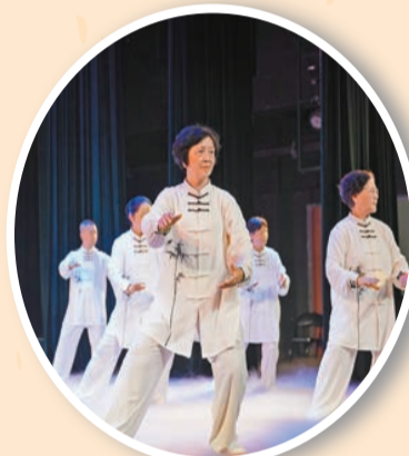
舒緩運動如八段錦能使氣血順暢，有效降低血糖。