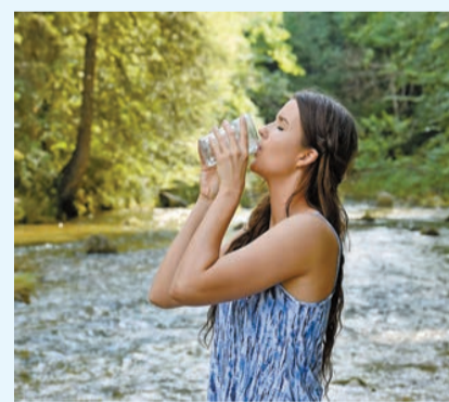
適當地補充水分可有降低血液濃度，減低腸中風的風險。

腸中風患者會感到持續性的腹部劇痛，老醫生表示：「痛楚會越來越強烈，而且一移動身體痛楚會更明顯，隨着缺血的腸子開始壞死，病人可