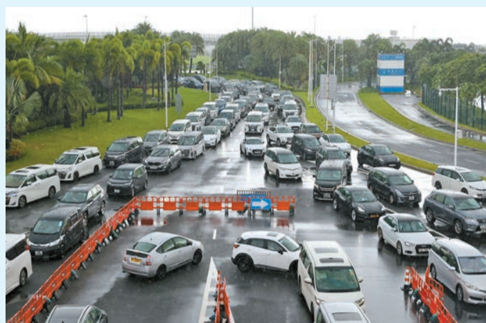
車輛在港珠澳大橋珠海公路口岸通道排隊通關。

港珠澳大橋海關相關負責人也告訴記者，為應對節假日增長的客車車流高峰，海關提前優化車道分流動線，充分利用科技信息化手段，針對客車車流高峰提前預警，動態調整監管人力部署，全力保障高峰時期加快驗放。此外，海關還進一步加強與口岸各部門及港澳有關方面聯動，持續促進粵港澳三地深度融合和便捷往來。海關提醒，預計6月10日15時至21時將迎來港珠