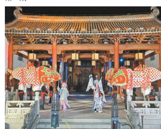
徽州非遺嬉魚燈、徽劇現場展示。

「和諧節日」線上文化交流系列活動於2024年由中國駐美國大使館與美國非營利機構「世界藝術家體驗」組織發起，選取中國特色傳統節日，開展中美人文藝術和思想交流，推動不同文化間交流互鑒，本次在黃山市開展的端午節活動為系列活動的第二期。