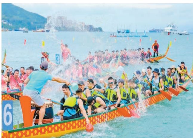
2024粵港澳大灣區（深圳南澳）海上龍舟賽。

為了讓遊客們能夠充分體驗南澳的魅力，南澳還大力聯動周邊景區、酒店、民宿、餐廳等企業，推出系