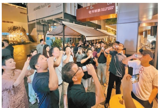
啤酒挑戰賽現場。

【香港商報訊】記者羅柳斌報道：6月8日，「2024羅湖啤酒趴」在深圳天河城正式啓動。本次活動以「來羅湖「啤」一夏」為主題，巧妙融合了運動的活力與啤酒文化的魅力，同時發布羅湖微醺地圖，為市民和遊客帶來了全新的夏日體驗。