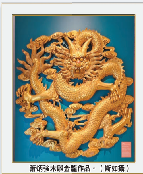
蕭炳強木雕金龍作品。