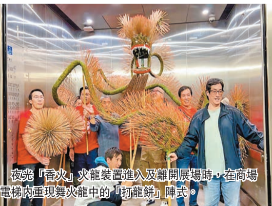
夜光「香火」火龍裝籌進入及離開展場時，在商場電梯內重現舞火龍中的「打龍餅」陣式。