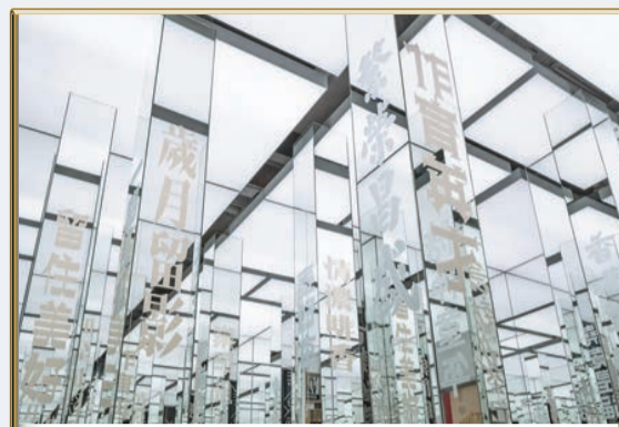
「GATE33」現正舉辦「愛你一萬字」展覽，闡述九龍城、土瓜灣等舊區的文化及人情味。

近年，香港多間新的博物館落成，如香港故宮、M+等，城中的藝術氛圍濃厚，連帶商場、商廈亦闢出空間舉辦展覽，藝術與公共空間的結合，成為一些商場的經營策略。