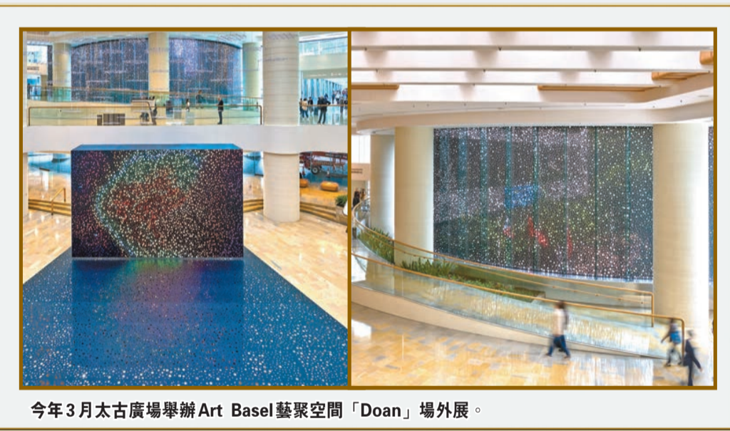
今年3月太古廣場舉辦 Art Basel 藝聚空間「Doan」場外展。