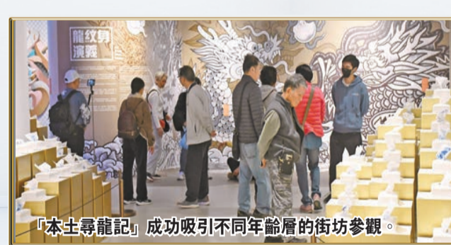
「本土尋龍記」成功吸引不同年齡層的街坊參觀。