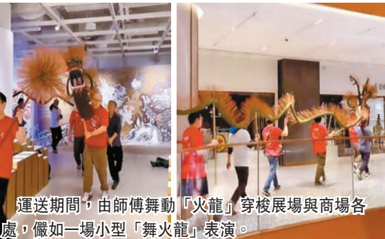
運送期間，由師傅舞動「火龍」穿梭展場與商場各處，儼如一場小型「舞火龍」表演。

作為營運不足一年的新商場，AIRSIDE 由開幕至2024年5月已舉辦過4次展覽，每次策展從籌備到現場布置，團隊需歷經數月至半年的籌備，工作強度不比傳統美術館低。不論展覽動線、空間設置、燈光照明等布置也不比畫廊差。