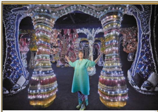
太古舉辦藝術家 Joana Vasconcelos 的大型裝置展覽，展品並延伸至辦公區域。