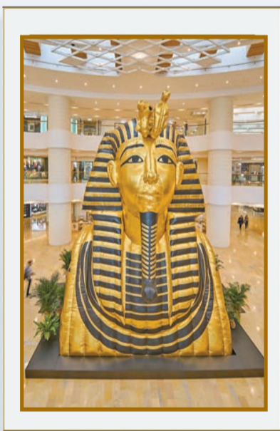
▲太古廣場展出安沃·艾力克10米高的巨型作品《重力》，曾引起一陣哄動。（圖片由安沃·艾力克、Ben Brown Fine Arts、太古廣場提供）

李德智表示，把藝術文化體驗融入日常生活是企業的理念。「集團開展了『ArtisTree』系列，委託不同藝術家為 ArtisTree 創作具啟發性的原創藝術、文化展覽及表演。透過多元節目為大眾生活增添色彩，擴大本地藝術文化的觀眾群。」正如當代藝術大師安迪·沃荷說過：「總有一日，所有百貨商場將會變成美術館，而所有的藝術館將會變成百貨商場。」現今生活、藝術與商業的邊界逐漸模糊，藝術館開始與商業品牌合作生產文創商品、引進特色餐廳，市民觀賞展覽之餘，可到館內商店購買文創產品、享用美食，藝術商業化。反過來說，商場開始廣辦展覽，培養大眾對藝術文化的興趣，將商業藝術化。近年香港的文藝氣息越加濃厚是事實，藝術與商業相輔相成，看來已迎來明媚的春天。