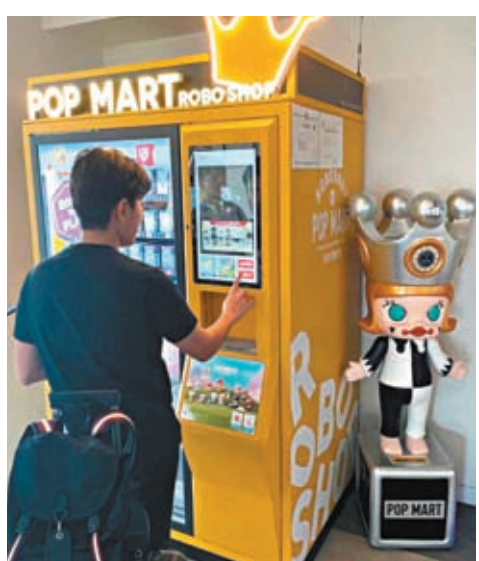
◆泰國國會議員在中國的泡泡瑪特自動售賣機上為女兒挑選禮物。香港文匯報北京傳真