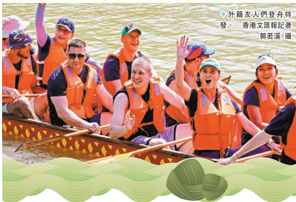
◆外籍友人們登舟待發。