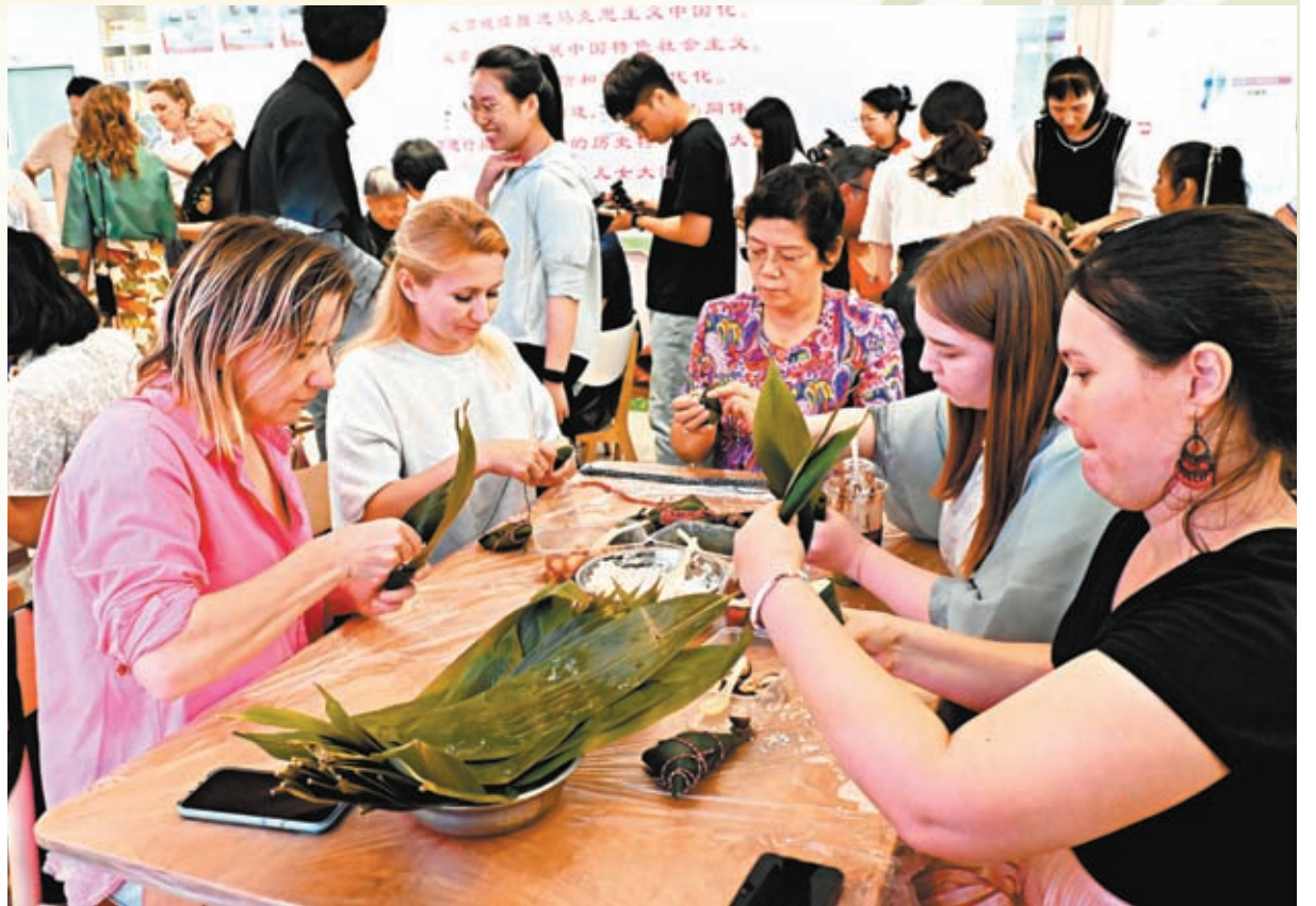
◆在深圳的外籍友人體驗中國端午包糉子的傳統習俗。

6月10日，由深圳市南山區人民政府主辦的「第六屆大沙河龍舟邀請賽」在南山區大沙河長廊盛大舉行。在參賽的25支龍舟隊中，由來自德國、英國、美國、意大利、瑞典、巴基斯坦、巴西、菲律賓等11個國家的外籍友人組成的「精彩蛇口國際友人家」頗為吸睛。