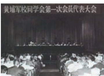
◆1985年，黃埔軍校同學會第一次會員代表大會在北京召開。

1984年6月16日，在鄧小平親切關懷下，徐向前、聶榮臻等黃埔先輩在北京發起成立了黃埔軍校同學會，宗旨為「發揚黃埔精神，聯絡同學感情，促進祖國統一，致力振興中華」，在海內外引起廣泛關注。1985年黃埔軍校同學會召開第一次會員代表大會，決定團結台灣和海外黃埔同