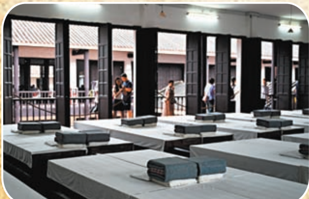
◆黃埔軍校學生宿舍場景復原。