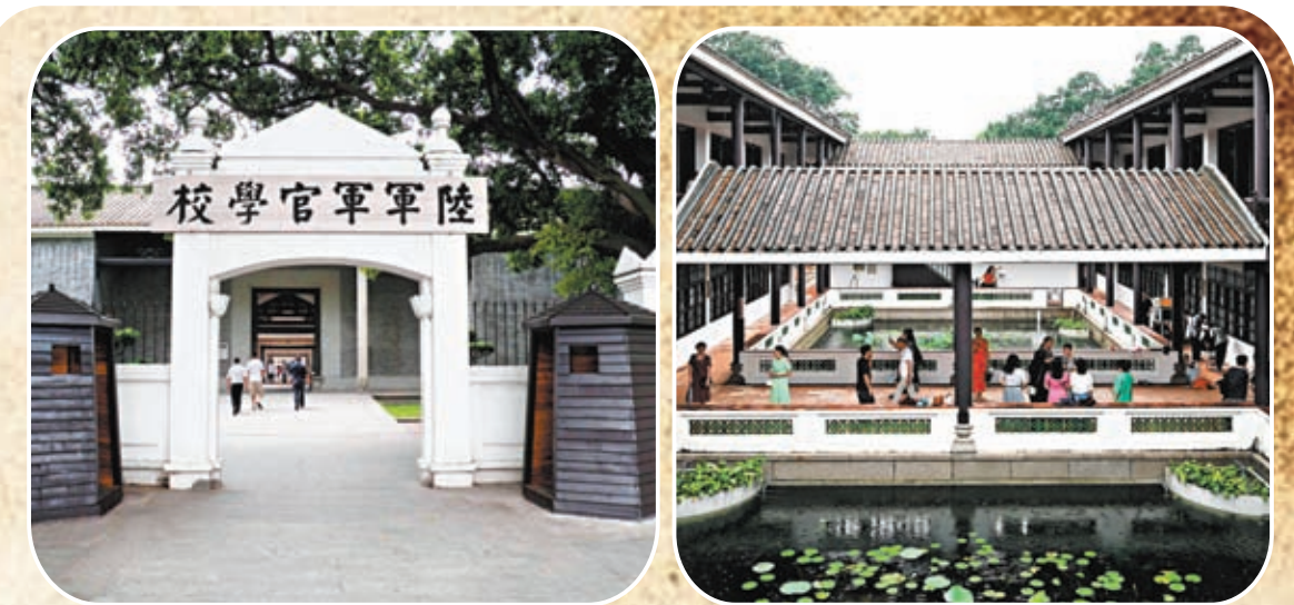
◆國共第一次合作的產物——黃埔軍校。 ◆6月16日，黃埔軍校舊址紀念館重新開館。