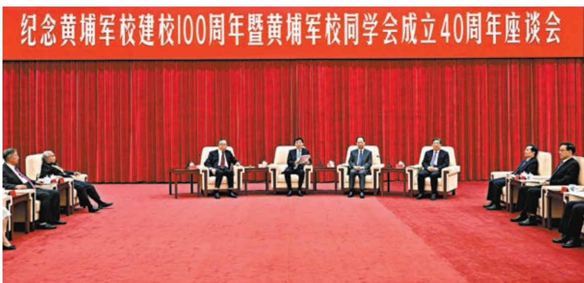
◆6月17日，紀念黃埔軍校建校100周年暨黃埔軍校同學會成立40周年座談會在北京舉行。中共中央總書記、國家主席、中央軍委主席習近平發來賀信，代表中共中央向黃埔軍校同學會表示熱烈祝賀，向廣大海內外黃埔同學及其親屬致以誠摯問候。會上宣讀了習近平的賀信。中共中央政治局常委、全國政協主席王滬寧出席並講話。

中央和國家機關有關部門、有關團體負責同志，有關民主黨派中央負責人，海峽兩岸、港澳和海外黃埔同學及親屬代表，省級黃埔軍校同學會負責人等參加座談會。