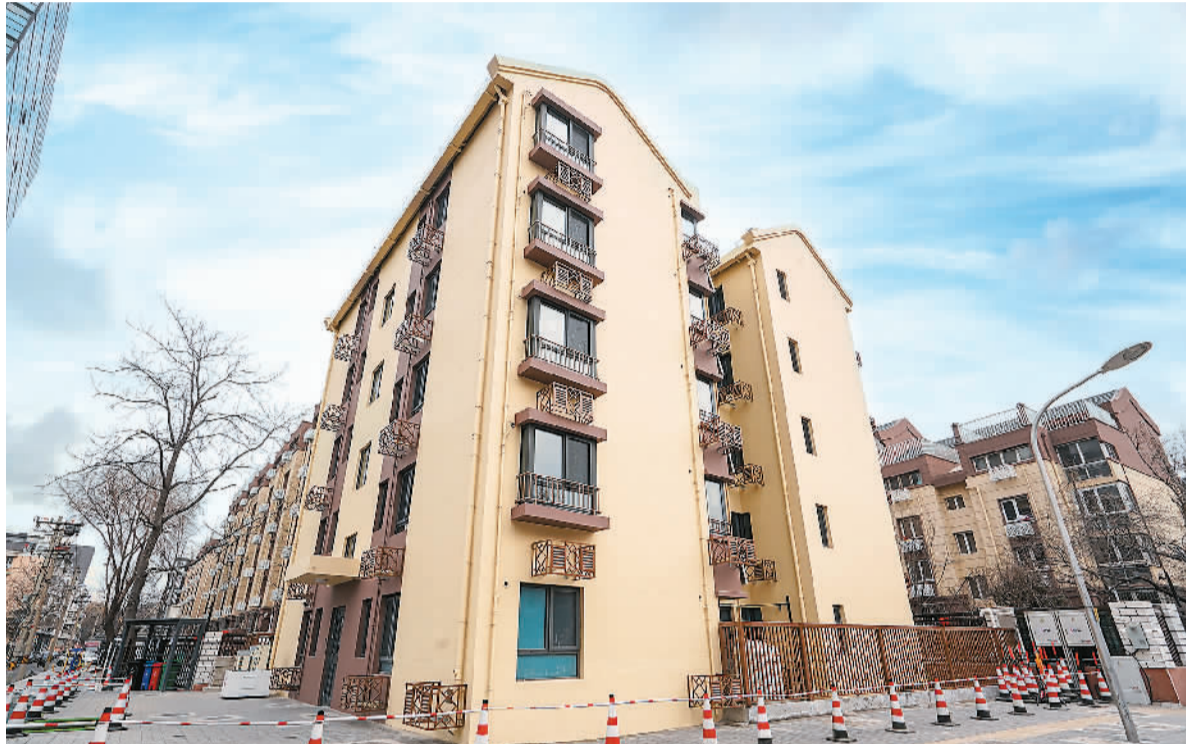
▲北京市西城区桦皮厂胡同8号楼外景。 ▲北京市西城区桦皮厂胡同8号楼改造项目现场，汽车吊在吊装房屋建筑模块。

“传统的建筑模式中，建筑工期受天气等不可控因素影响较大。而在工厂里造房子，经过了专业培