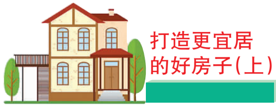
打造更宜居的好房子(上)