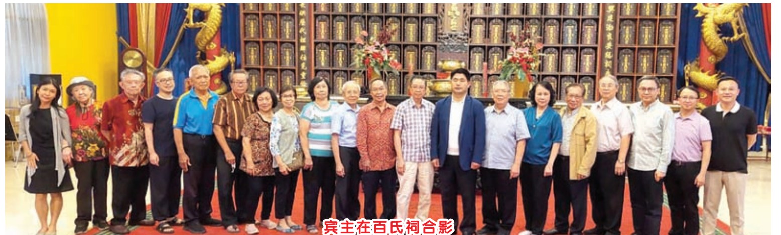
宾主在百氏祠合影