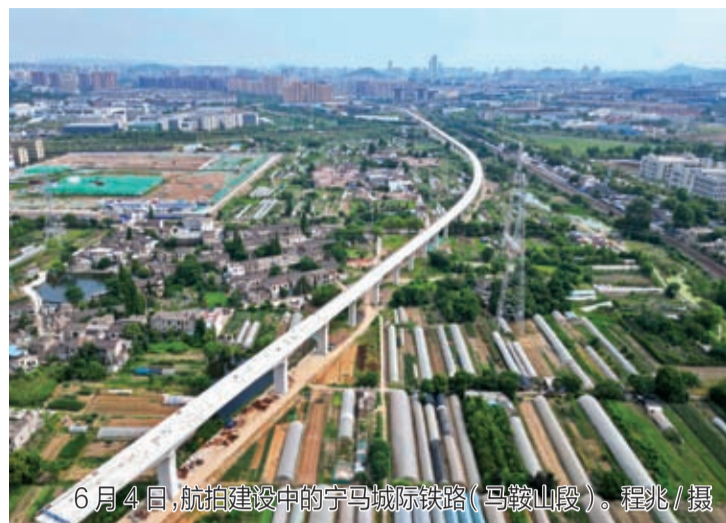
6月4日,航拍建设中的宁马城际铁路(马鞍山段)。

指数报告构建了包括资源共享、创新合作、成果共用、产业联动和环境支撑5项一级指标、20项二级指标