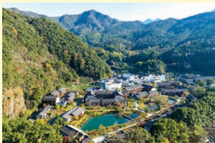
池州市石台县民宿群,与青山绿水融为一体。