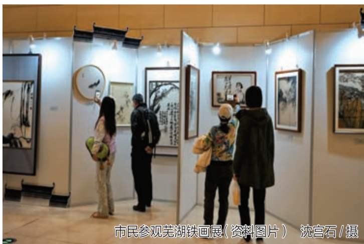
市民参观芜湖铁画展(资料图片)

以铁为墨,化砧为纸,锻铁成画。在储铁艺看来,铁画的美主要在于铁的金属质感,浑厚粗犷,具有厚重感和力量美。好的铁画作品远观墨