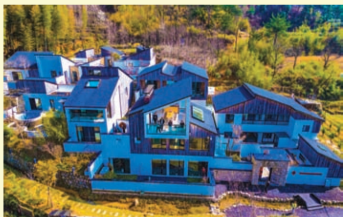
安庆市岳西县石关乡特色民宿清溪行馆。