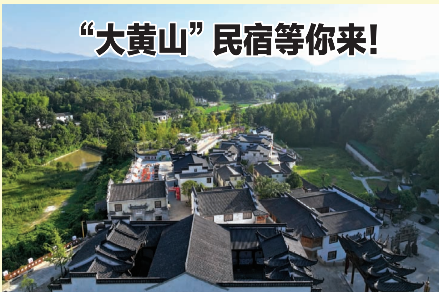
黄山区三口镇燕窝里民宿掩映在一片绿林之中。