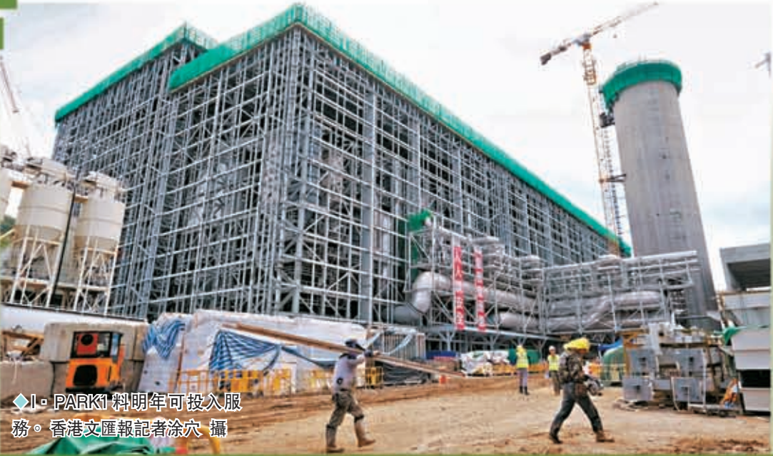
◆I·PARK1料明年可投入服務。