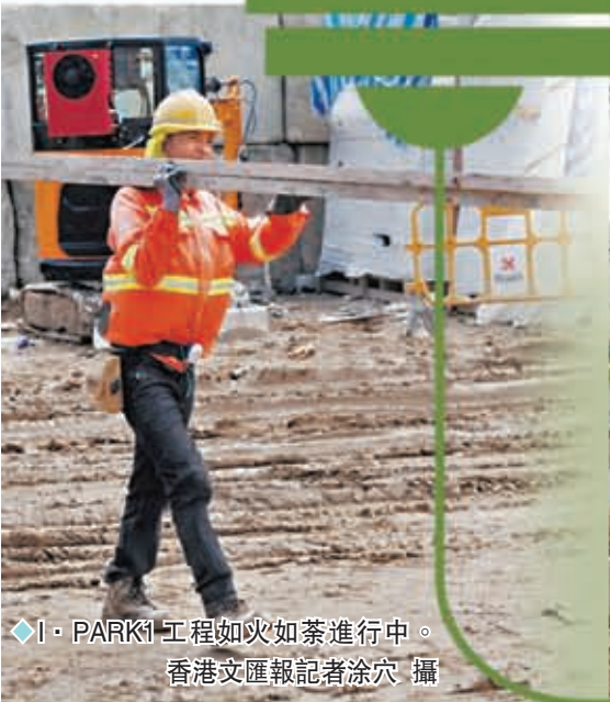
◆I·PARK1工程如火如荼進行中。